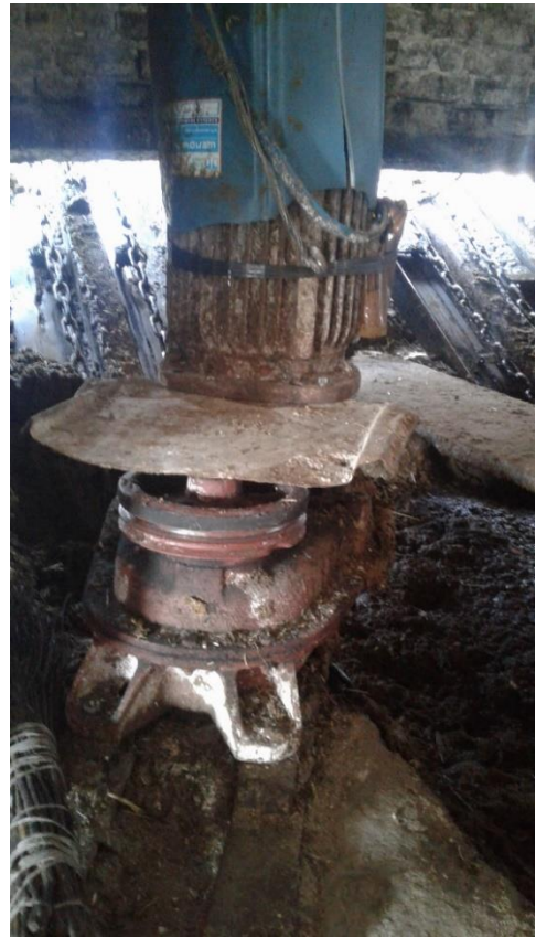
Не ограждена ременная передача системы навозоудаления