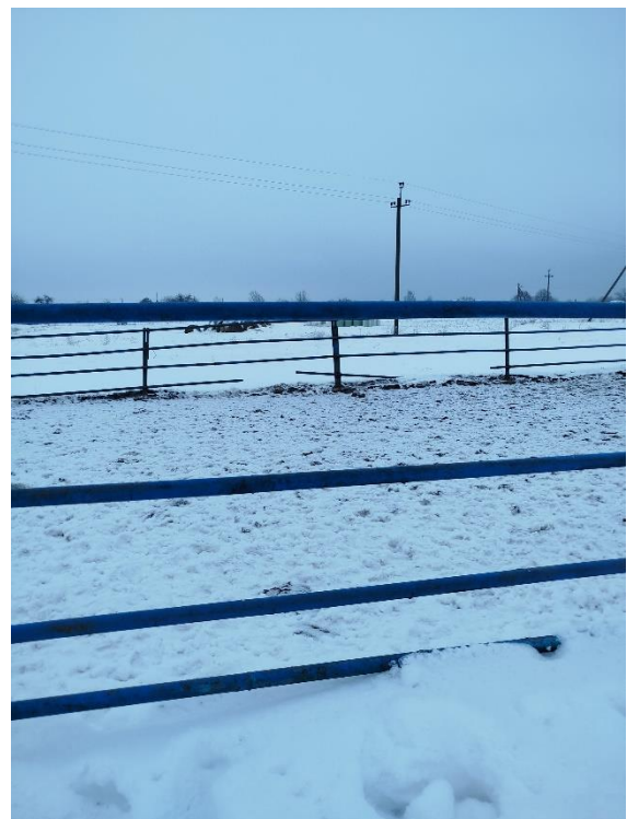
Элементы ограждений стойл находятся в неисправном состоянии

Обслуживание птицы в клетках необходимо осуществлять при отключенных пометных скребковых конвейерах, раздатчиках кормов, механизмах сбора яиц. Мыть, дезинфицировать клетку следует при отключенном напряжении в электрической сети.