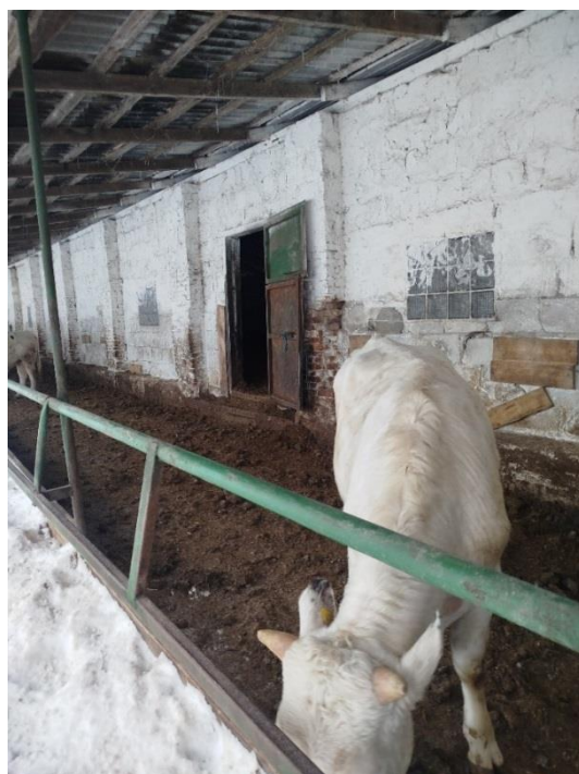
Двери из секций на выгульные площадки не оборудованы с двух сторон запорными устройствами