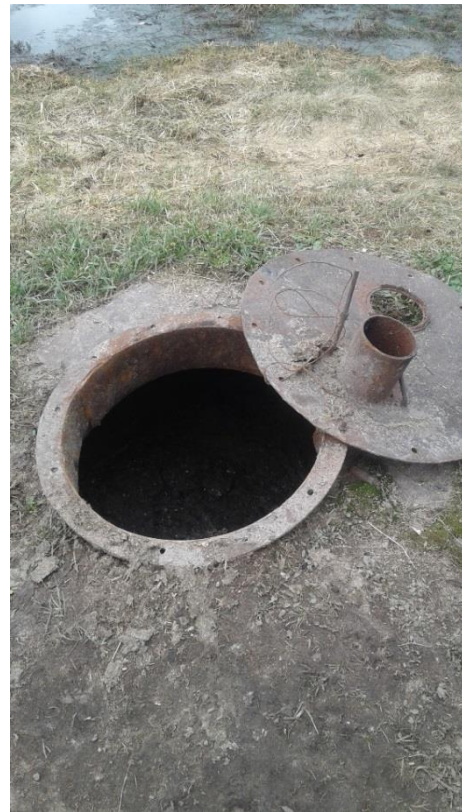
Не закрыты люки подземных приемников сточных вод