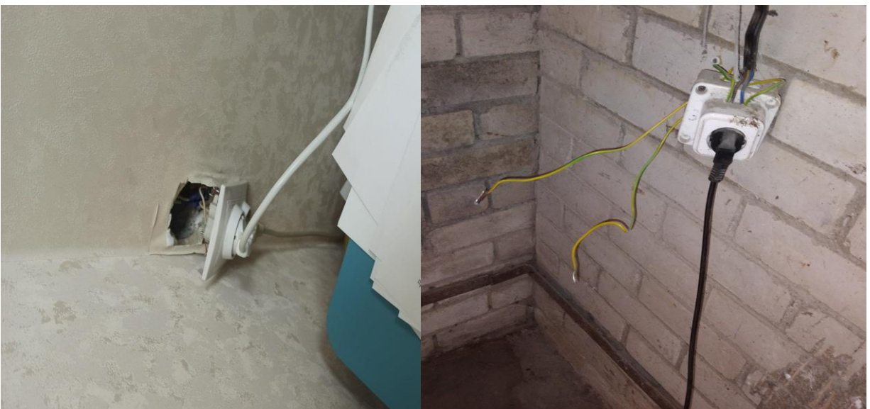
Не закрыты токоведущие части розеток.