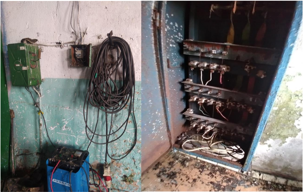
Не обеспечены безопасные условия труда (распределительный щит не закрыт на запирающее устройство).