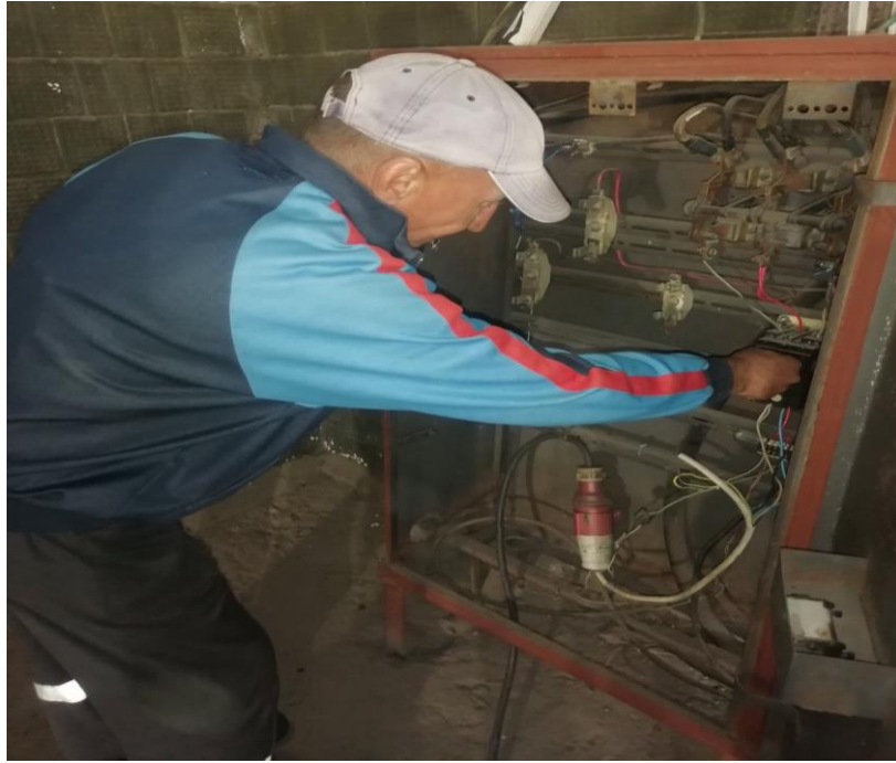
Выполнение работ без применения СИЗ.