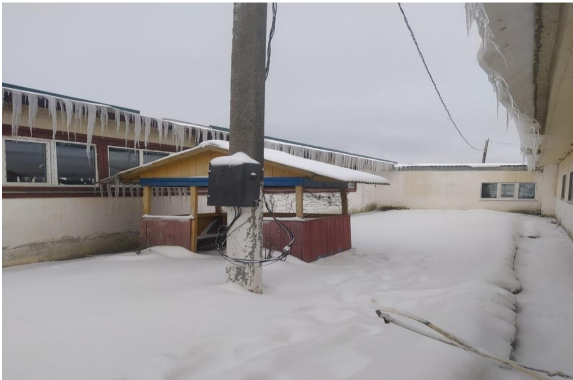
Электроустановка находится на опоре линии электропередач в технически неисправном состоянии (токоведущие части доступны для случайного прикосновения).