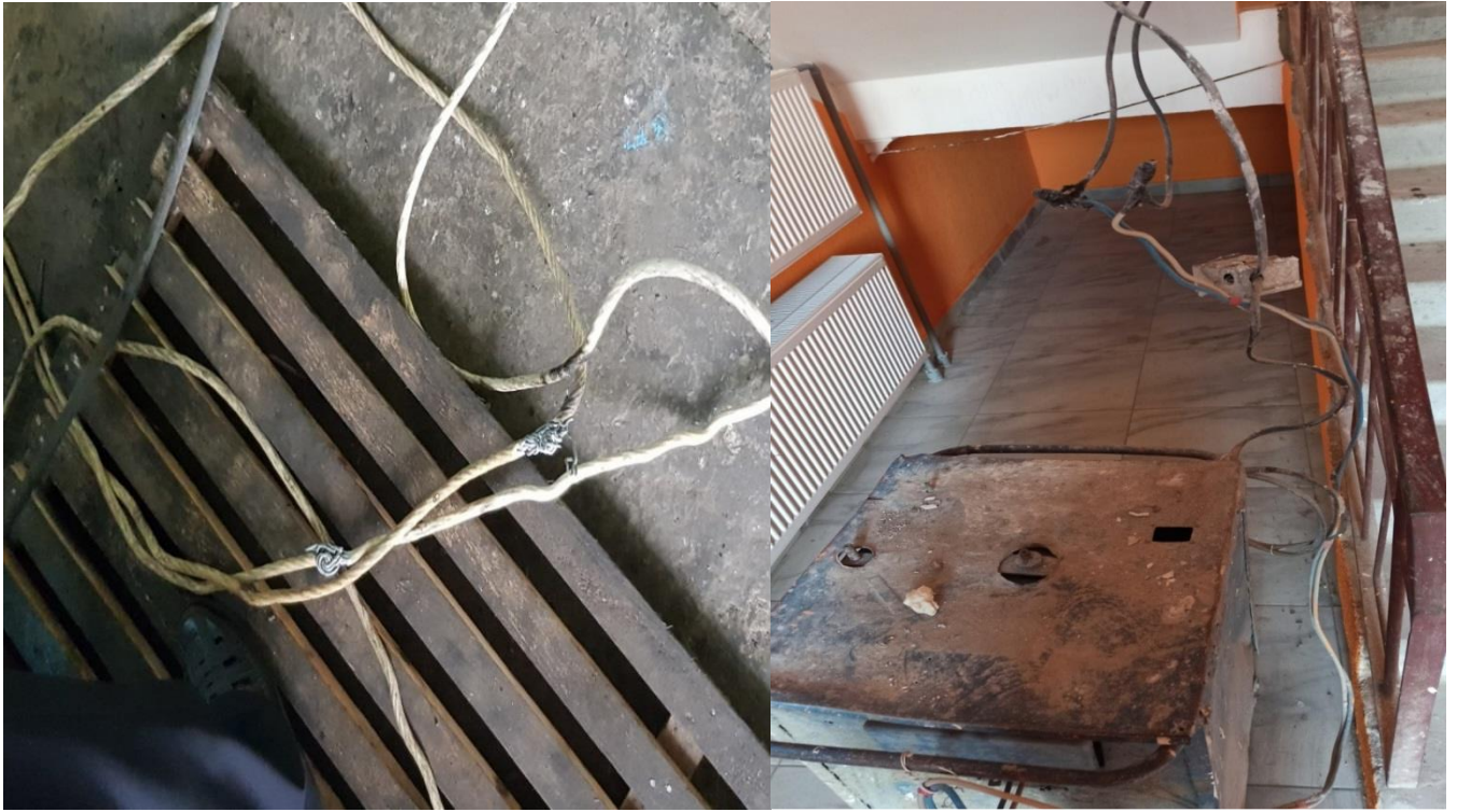
Не закрыты токоведущие части проводов.