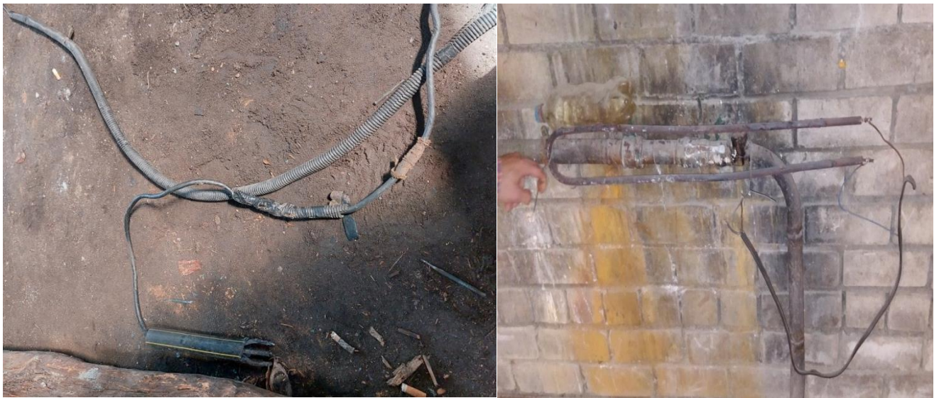
Применение самодельного электродержателя, обогревательного устройства (токоведущие части доступны для случайного прикосновения).

При проведении эксплуатационных, монтажных, ремонтных, наладочных работ, испытаний, измерений и диагностики в электроустановках должны соблюдаться требования технических нормативных правовых актов в сфере электробезопасности.