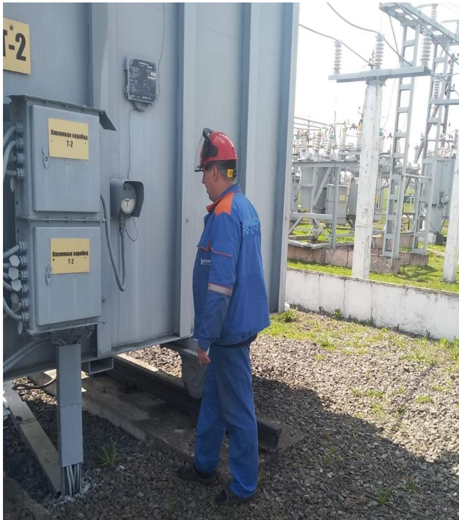
Выполнение работ без применения специальной обуви.