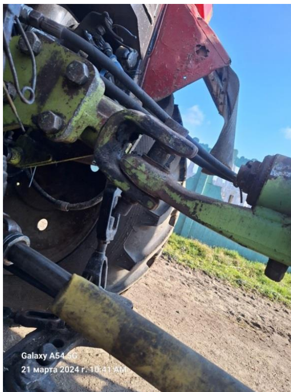
Отсутствует серьга в стопорном пальце

Агрегатирование сельскохозяйственных машин допускается с малыми сельскохозяйственными машинами с учетом тягового класса. При этом соединение сельскохозяйственных машин с прицепными (навесными) малыми сельскохозяйственными машинами должно быть надежным и исключать самопроизвольное их рассоединение.