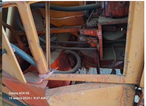
Отсутствуют защитные ограждения на ременных и цепных передачах протравителя семян ПС 10

Смену, очистку и регулировку навесного оборудования сельскохозяйственных машин, находящегося в поднятом состоянии, следует проводить только после принятия мер, предупреждающих