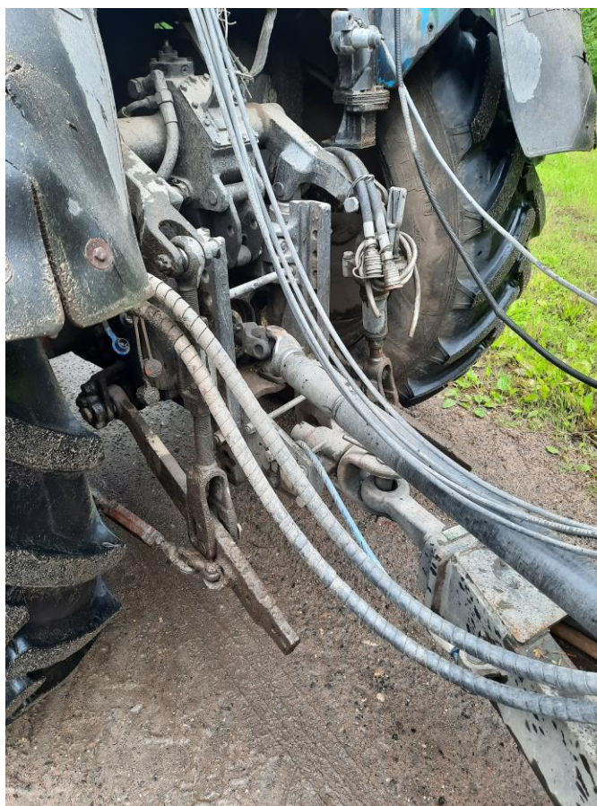
Отсутствует защитное ограждение карданного вала отбора мощности

сцепка (расцепка) прицепного (навесного) оборудования до полной остановки сельскохозяйственной машины.